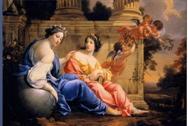
Simon Vouet (1590-1649), Muzele Urania și Calliope

▣ În mitologia modernă, Calliope, muza versurilor epice, apare ca o zeiță care ucide scriitorii în momentul în care își încheiau lucrarea. Obiceiul crud a fost justificat de necesitatea de a păstra capodopera într-o singură copie, fără posibilitatea de a crea o alta. Acest mit a fost folosit în producția seriei americane de televiziune "Supernatural" de Eric Kripke, filmată în 2006.