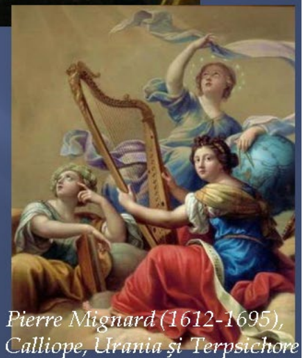
Pierre Mignard (1612-1695), Calliope, Urania și Terpsichore